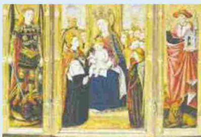
Madonna col Bambino di Jacomart Baço e Joan Reixach

Roma, Palazzo delle Esposizioni, fino al 26 maggio