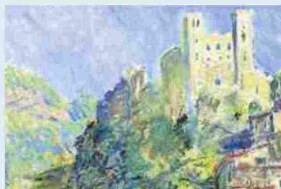
Le Château de Dolceacqua di Claude Monet