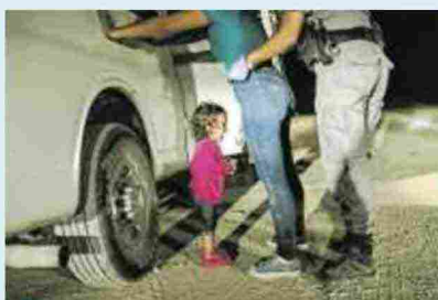
Crying Girl on the Border di John Moore

Fontanellato (PR), Labirinto della Masone, fino al 28 luglio