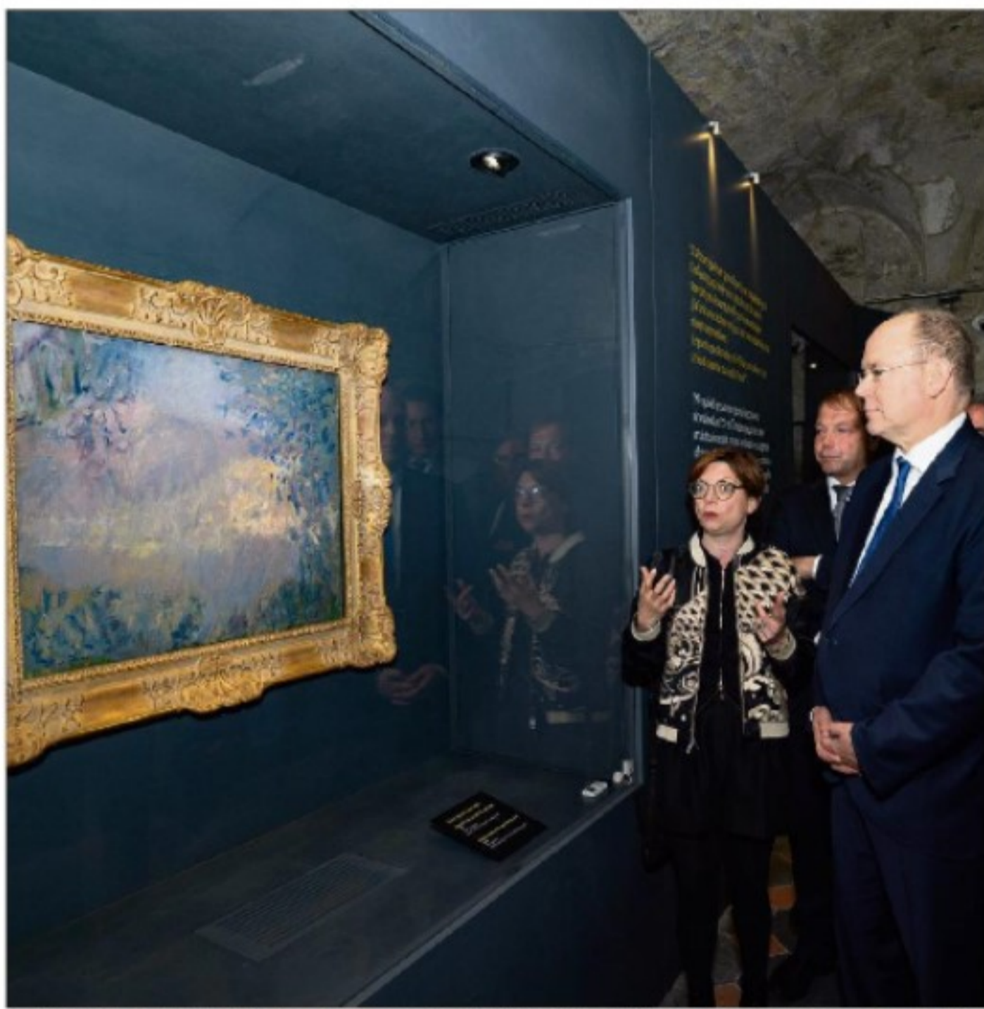
Le souverain s'est rendu dans les deux communes italiennes frontalières qui rendent hommage cet été au maître de l'impressionnisme.